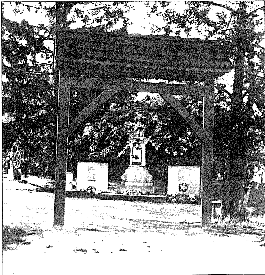
Emlékmű a háborúk áldozatainak