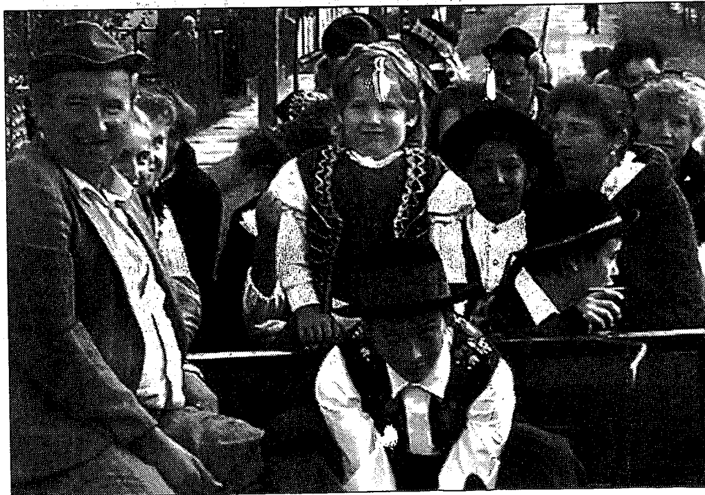
Kevés szőlő ellenére jó kedvvel ünnepelték a szüretet a véseiek